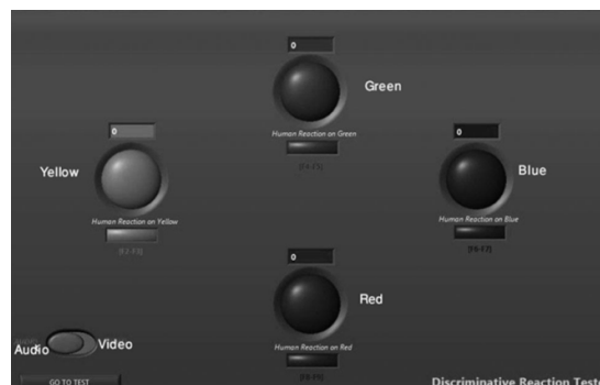
شکل 2- تصویر چهار دایره ی رنگی برای تست های زمان عکس‌العمل بینایی و شنوایی

چنانچه در منوی اولیه آزمونگر آزمون زمان عکس‌العمل را انتخاب می‌نمود، نرم افزار پنجره تست زمان عکس‌العمل را باز می‌کرد. در این بخش امکان ایجاد تحریک بینایی توسط روشن