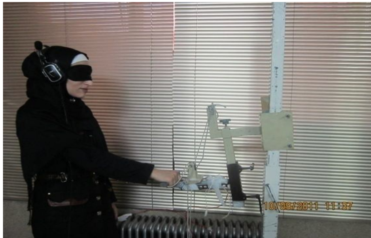
شکل 1- وضعیت قرارگیری فرد هنگام شروع تست

نسبت به عضله اصلی حرکت یعنی دلتوئید، زمانبندی عضلات بدست می‌آید. همچنین با محاسبه زمان بروز حداکثر فعالیت، مدت زمان فعالیت هر عضله نسبت به شروع فعالیت محاسبه می‌گردد.