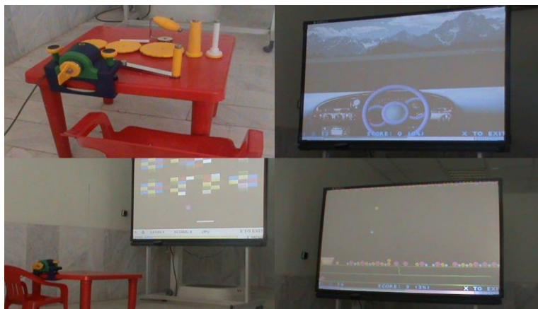
شکل ۱- سیستم واقعیت مجازی E-Link

افزایش دهد و هم کودک را نسبت به نحوه فعالیت خود آگاه سازد. برنامه تمرینی نیز به صورت روزانه ۱/۵ ساعت و یک روز در میان در مدت ۴ هفته بود و در صورت وجود زمان استراحت حین جلسه درمانی، تمرینات تا تکمیل یک ساعت و نیم تمرین ادامه پیدا می‌کردند.