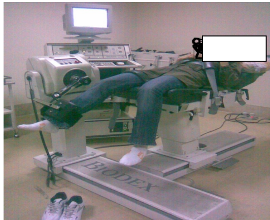
شکل ۱- قرار گیری فرد بر روی دستگاه بایودتکس سیستم ۳ و تنظیم آن برای انجام آزمون

کمپرشن ۲ دقیقه و در نهایت افلوراژ به مدت ۳ دقیقه استفاده می‌شد که در تمامی تکنیک‌ها از درجات ۲ و ۱ استفاده می‌شد.