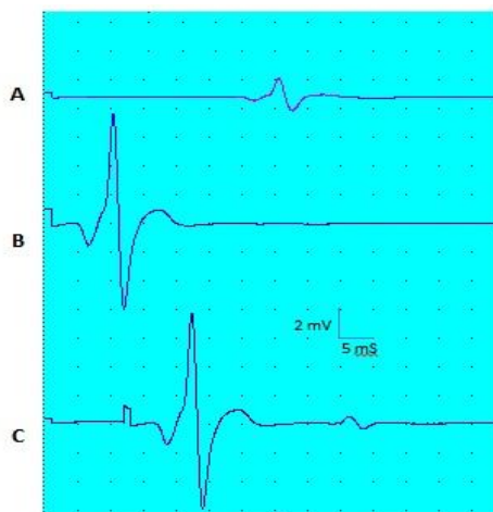
شکل 3- A- تحریک اول که باعث ایجاد رفلکس H می‌شود. B- تحریک دوم که باعث ایجاد موج M می‌شود. C- زوج تحریک که پاسخ H' را ایجاد می‌کند

در مرحله اول پس از آماده سازی فرد، تحریک‌های مورد نیاز برای برانگیختن آستانه ابتدایی، قله و شدت پایانی منحنی فراخوانی رفلکس H و Mmax ( حداکثر دامنه ثبت شده از فعالیت الکتریکی عضله)، با فرکانس 0/3Hz، طول پالس مربعی 1