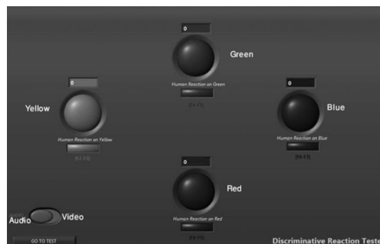
شکل 2- تصویر چهار دایره ی رنگی برای تست های زمان عکس‌العمل بینایی و شنوایی

چنانچه در منوی اولیه آزمونگر آزمون زمان عکس‌العمل را انتخاب می‌نمود، نرم افزار پنجره تست زمان عکس‌العمل را باز می‌کرد. در این بخش امکان ایجاد تحریک بینایی توسط روشن