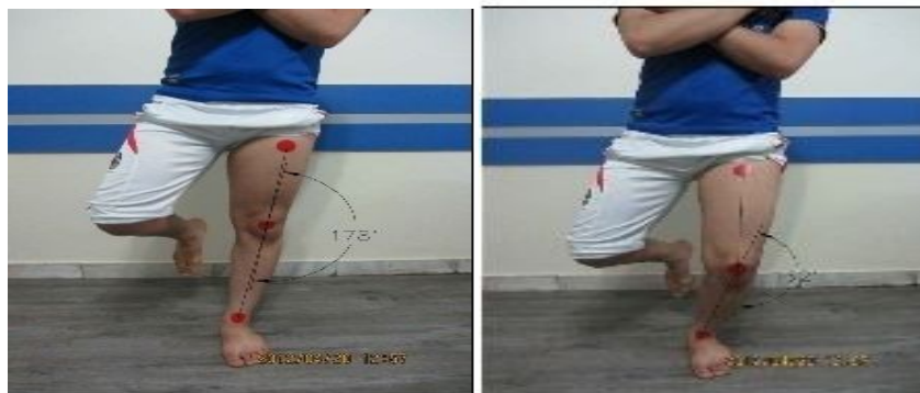
شکل 3- آزمون چمباتمه تک پا (Single Leg Squat)

جهت ارزیابی عملکرد عضلات ابدکتور و روتاتور خارجی ران، از تست چمباتمه تک پا (Single Leg Squat) استفاده شد. ابتدا نشانه‌هایی روی اندامهای تحتانی افراد، در بالای ران در امتدادخطی که خار خاصره قدامی - فوقانی را به وسط مفصل تیبیوفمورال متصل می‌کند، در وسط مفصل تیبیوفمورال و دیگری در وسط مفصل مچ پا قرار داده شد. برای شروع این تست در حالتی که فرد روی اندام مورد تست ایستاده و زانو در صفر درجه بود از اندام تحتانی وی عکس گرفته می‌شد. سپس از وی خواسته می‌شد تا حرکت چمباتمه (squat) را تا زاویه 45 درجه انجام دهد. از این وضعیت نیز عکس گرفته می‌شد. برای مشخص کردن این که شخص زانو را تا 45 درجه خم می‌کند از نشانه‌گذاری زاویه روی دیوار در کنار فرد استفاده شد. با استفاده از نرم‌افزار Auto CAD زاویه بین نشانه‌گذارها در دو وضعیت صفر درجه و 45 درجه چمباتمه زانو اندازه‌گیری شد، ابتدا