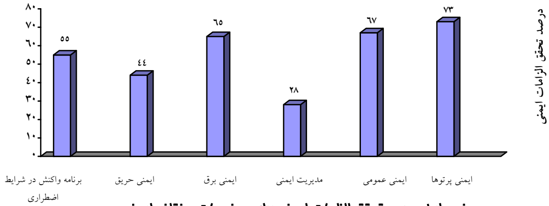
نمودار ۱: درصد تمقق الزامات ایمنی برای موضوعات مختلف ایمنی در مجموع بیمارستانهای مورد بررسی