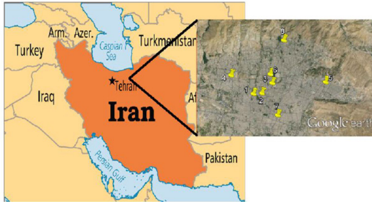
شکل ۲: مراکز رادیوتراپی مورد ارزیابی

EEC ضریب تعادل رادن با دخترانش است که برای محیط بسته ۰/۴ در نظر گرفته می شود و ۱۲ ضریب دز جذبی برای رادن است. occupancy factor برابر با میزان ضریب حضور فرد در سال