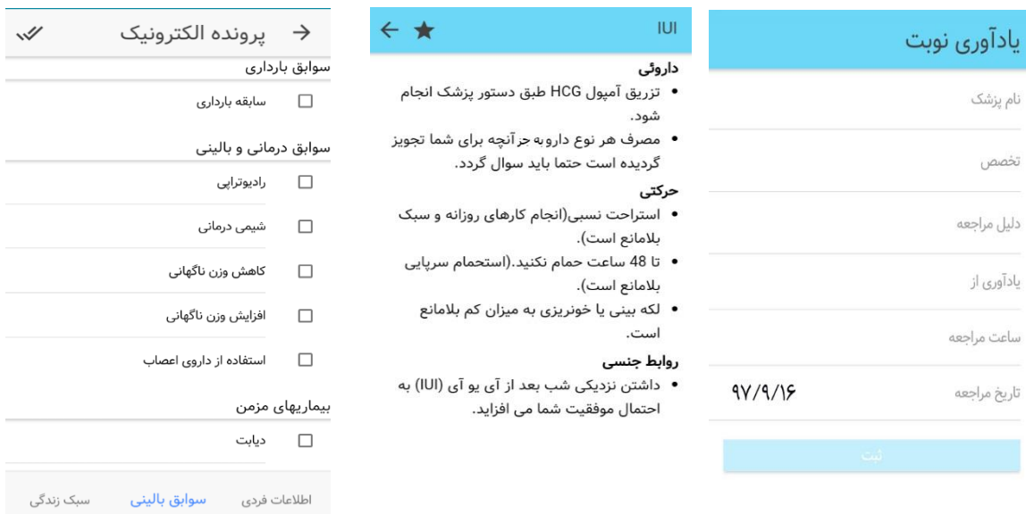
شکل ۳: صفحات پرونده‌ی الکترونیک، خودمراقبتی، یادآور

در شکل ۲ صفحه‌ی «روش های کمکی» دیده می‌شود که جهت آشنایی هر چه بیشتر زوجین با مراحل سیکل های درمانی روش های کمکی تولیدمثلی، آیتم جداگانه‌ای جهت معرفی سیکل های درمانی ایجاد شد. همچنین در این شکل بخشی از برنامه‌ی کاربردی قابل مشاهده است که به معرفی مراکز درمانی به تفکیک استان‌ها می‌پردازد، تا زوجین بر اساس