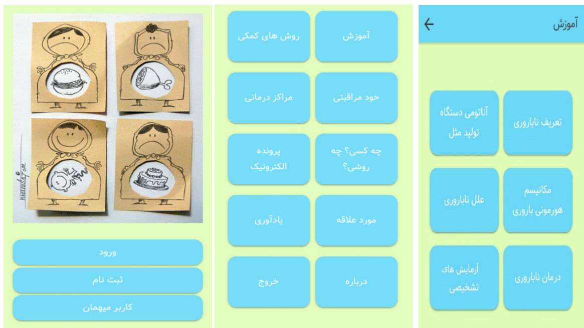
شکل ۱: نمایشی از صفات برنامه‌ی کاربردی

جدول شماره‌ی سه با عنوان ابزارهای مدیریت بیماری با دو زیرمجموعه یادآورها و ردگیری طراحی شده است که یادآور زمان مصرف داروها در زیرمجموعه اول و ردگیری میزان مصرف داروها بر اساس دستور پزشک در زیرمجموعه دوم موفق به دریافت بیشترین امتیازها شدند. در پاسخ‌های شرکت‌کنندگان پاسخی با میزان تاثیر بی‌اثر، خیلی کم و کم یافت نشد. طبق نظر شرکت‌کنندگان تنها دو آیت قد و نوع بیمه‌ی تحت پوشش با میزان تاثیر متوسط در آیت‌های پرسش‌نامه وجود داشت. همچنین سه آیت با تاثیر زیاد شامل نام و نام خانوادگی، شغل و