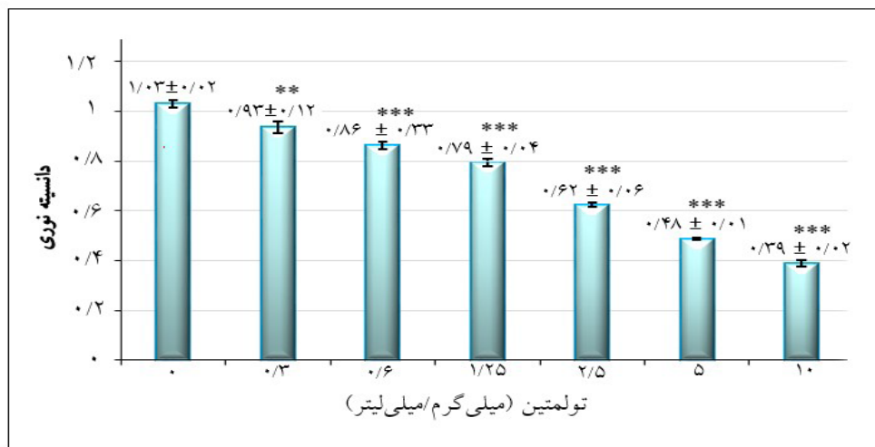
*** و ** به ترتیب با P < 0/05 و P < 0/001 نشانگر اختلاف معنادار نسبت به گروه شاهد (غلظت صفر) است.

در ادامه، جهت ارزیابی بیان ژنی از طریق Real Time PCR پرایمرهای مخصوص ژن‌های BAX و BCL2 استفاده گردید (جدول ۱). در نهایت جهت بررسی‌های آماری ابتدا با استفاده از آزمون کولموگروف-اسمیرنوف توزیع طبیعی داده‌ها بررسی شد و پس از حصول اطمینان از طبیعی بودن توزیع داده‌ها، آزمون آماری آنالیز واریانس یکطرفه (ANOVA) و آزمون تعقیبی توکی با استفاده از نرم افزار SPSS استفاده گردید. اختلاف بین گروه‌ها در سطح \alpha < 0/05 معنادار در نظر گرفته شد.