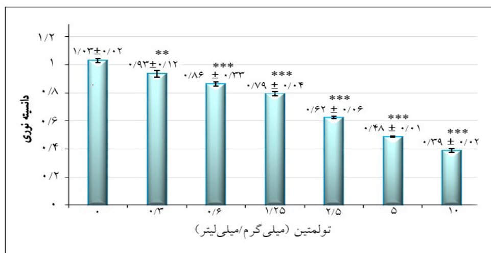
*** و ** به ترتیب با P < 0/05 و P < 0/001 نشانگر اختلاف معنادار نسبت به گروه شاهد (غلظت صفر) است.

نتایج این تحقیق نشان داد که زنده‌مانی سلولی AGS، در گروه دریافت‌کننده‌ی ۰/۳، ۰/۶، ۱/۲۵، ۲/۵، ۵ و ۱۰ میلی‌گرم بر میلی‌لیتر تولمتین نسبت به گروه شاهد به‌طور معنی‌داری کاهش یافت. ازسویی، اثر سیتوتوکسیک تولمتین بر سلول‌های سرطانی معده وابسته به غلظت بوده و با افزایش غلظت تولمتین زنده‌مانی سلول‌ها به‌طور معناداری دچار کاهش گردید (نمودار ۱). همچنین دوز IC50 تولمتین با استفاده از روش رگرسیون غیرخطی اندازه‌گیری شد و غلظت IC50 تولمتین برابر ۳/۳۶ میلی‌گرم/میلی‌لیتر تعیین گردید.