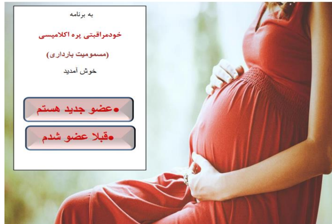
شکل ۲: صفحه ورود به برنامه کاربردی خودمراقبتی پره اکلامپسی مبتنی بر اندروید

گزارش گیری و اطلاع رسانی و زیر صفحات فرعی مرتبط با آن‌ها می‌باشد. همچنین در این صفحه از کاربر خواسته شده است تا با نظرات ارزنده‌ی خود از دو طریق ایمیل و پیام کوتاه پژوهشگران را در بهبود این برنامه یاری نماید.