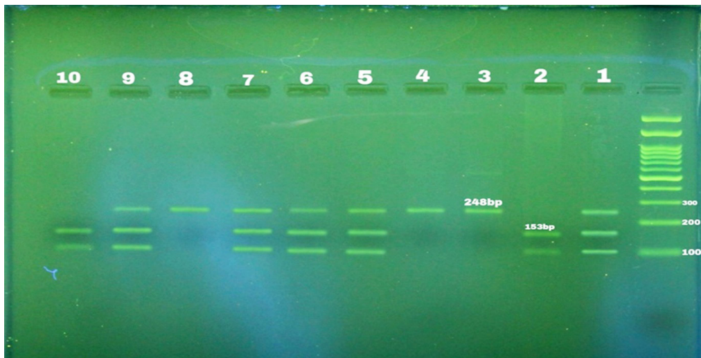
شکل ۱: نمونه‌ی تفکیک باندهای DNA در نمونه‌های سالم بر روی ژل الکتروفورز

مقایسه‌ی نحوه‌ی توزیع ژنوتیپ‌ها بین دو جنس مرد و زن به تفکیک گروه بیمار و سالم نیز در جدول ۳ نشان داده شده است. نتایج آزمون کای دو نشان داد که در گروه بیمار، بین دو جنس از نظر فراوانی توزیع ژنوتیپ‌های دافی اختلاف آماری معنی‌داری وجود ندارد ( P=۰/۵۸۸ ). از سوی دیگر نیز طبق نتایج آزمون