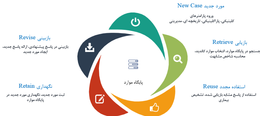
شکل ۲: معماری سیستم در مازول تشخیص افتراقی