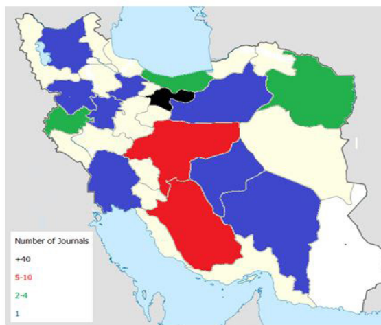
شکل ۲: پراکندگی مجلات نمایه شده حوزه‌ی پزشکی در سطح کشور

یافته‌های به دست آمده از مطالعه‌ی حاضر همچنین نشان داد که دانشگاه‌های علوم پزشکی تهران، شهید بهشتی و شیراز در میان سایر مراکز و دانشگاه‌های کشور بیشترین تعداد مجله‌ی نمایه شده را در اختیار داشته‌اند.