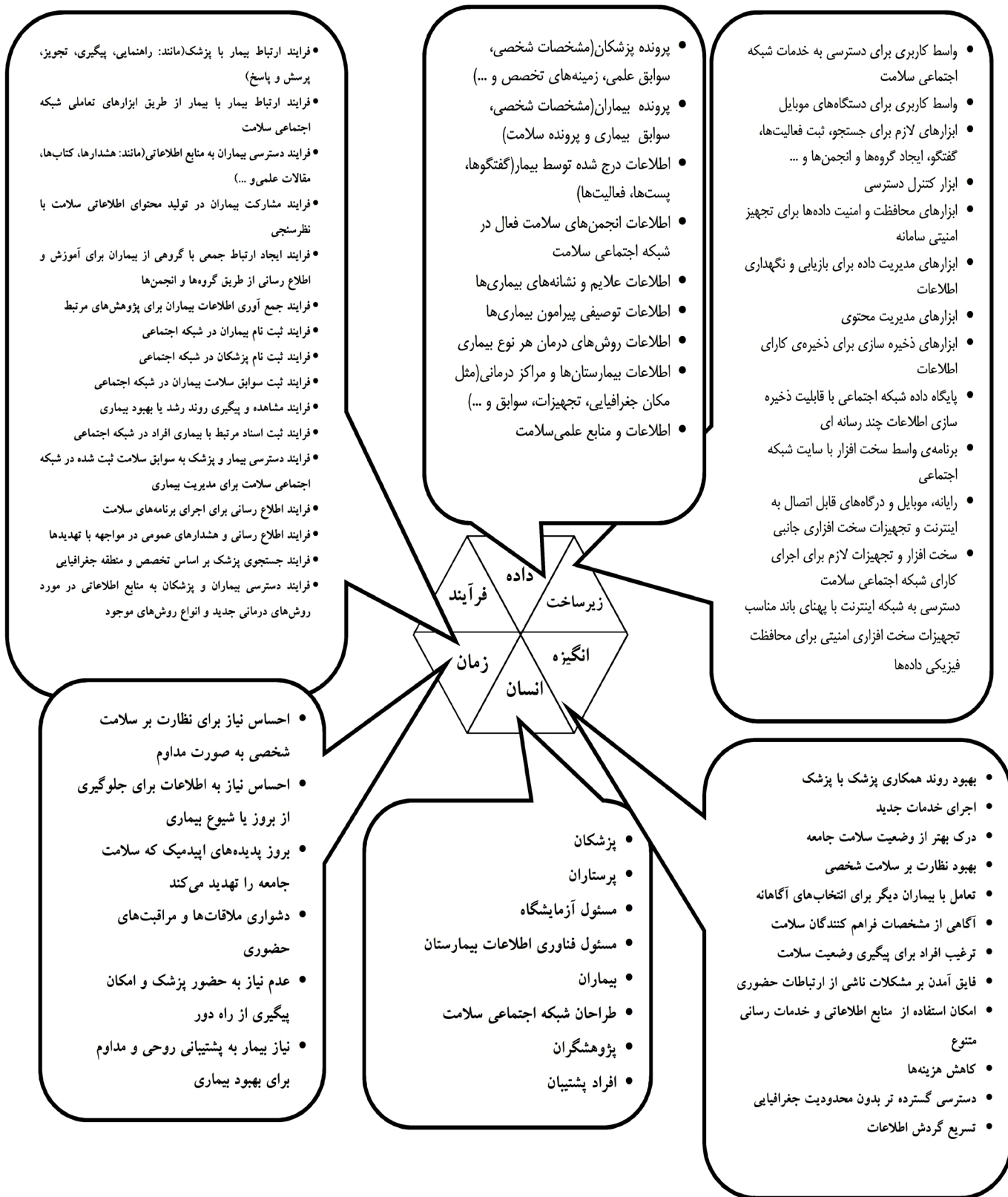
شکل ۱: مدل معماری مطلوب برای شبکه اجتماعی سلامت

از ۹ فرض بعد داده، همه تایید شدند. از ۱۷ فرض بعد فرآیند، ۱ فرض رد و ۱۶ فرض تایید شدند. از ۱۴ فرض بعد زیرساخت، همگی تایید شدند. در اینجا ۶ بعد انگیزه (۱۲ زیر سیستم)، انسان (با ۸ زیر سیستم)، زمان (۶ زیر سیستم)، فرآیند (۱۶ زیر سیستم)، داده (۹ زیر سیستم) و