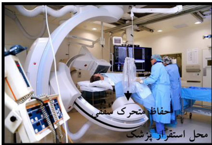
شکل ۲: محل تقریبی استقرار کارکنان آنژیوگرافی در اطراف دستگاه

کارکنان، همگی از روپوش‌سربی و تیروئیدبند استفاده کردند. باتوجه به این‌که برخی از کارکنان از عینک‌سربی استفاده کردند، به منظور امکان مقایسه‌ی نتایج، دزیمترهای TLD طوری روی سربند قرار گرفت که عینک‌سربی آنها را نپوشاند. در هر سه بیمارستان از دستگاه آنژیوگرافی زیمنس مدل Artis zee (تیوپ زیرتخت) ۸۰kVp استفاده شد که همگی مجهز به حفاظ سقفی هستند. در اتاق آنژیوگرافی آزمون‌های مختلفی از جمله PCI، SICD، CAG و TEVAR اجرا شدند. در حین آنژیوگرافی، عموماً پزشکان و رزیدنت‌ها در یک مکان ثابت در کنار تخت بیمار قرارداشتند، به‌طوری‌که منبع پرتوی دستگاه در سمت چپ صورت آنان قرار داشت و پرستاران و کارشناسان رادیولوژی حسب