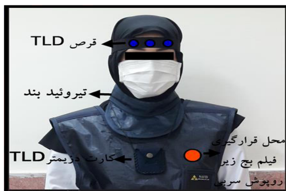
شکل ۱: نمونه‌ی نصب و مکان دزیمترهای TLD و فیلم‌بیج بر روی بدن یک پرتوکار