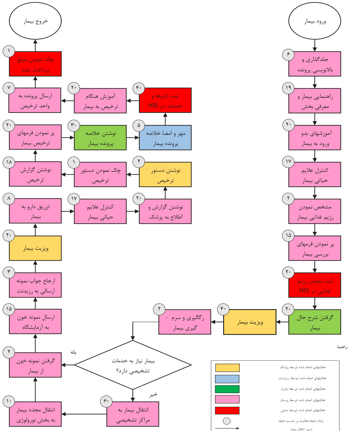
نمودار ۱: فرآیند درمان بیماران نورولوژی اطفال