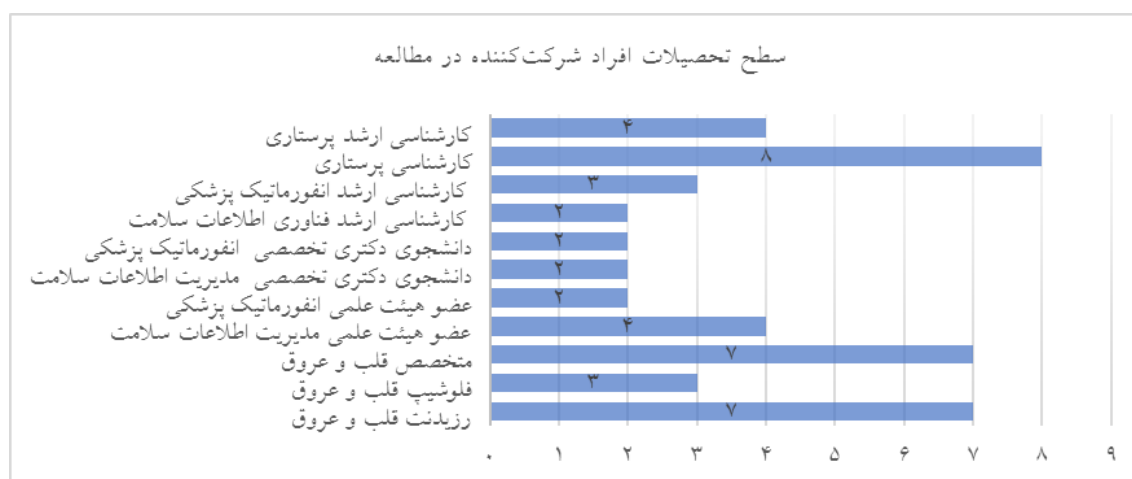
شکل ۲: نمودار سطح تحصیلات افراد شرکت‌کننده در این مطالعه به تفکیک تخصص و فراوانی

در مجموع ۴۴ نفر در این مطالعه شرکت کردند که ۴۷/۷٪ خانم بودند و میانگین سنی کل شرکت‌کنندگان تقریباً ۳۷ سال بود. ۱۷ پزشک، ۱۲ پرستار و ۱۵ نفر از رشته‌های مدیریت اطلاعات سلامت و انفورماتیک پزشکی بودند.