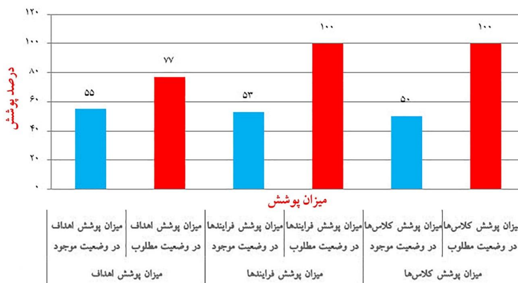
نمودار ۱: (ارزایی کارایی سیستم پیشنهادی نسبت به وضعیت موجود

زیرسیستم‌های غیرکارکردی در این لایه عبارتند از: امنیت، دسترس‌پذیری و اطلاعات پایه. لایه‌ی سوم لایه‌ی داده است. در لایه‌ی داده پایگاه اطلاعاتی جامع معاونت تحقیقات و فناوری دانشگاه قرار دارد که دربرگیرنده‌ی تمامی کلاس‌های داده‌های موجود در ماتریس CRUD می‌باشد. لایه‌ی آخر لایه زیرساخت است که شامل زیرساخت سخت‌افزاری، نرم‌افزاری و شبکه یکپارچه می‌باشد. همچنین سیستم اطلاعات مدیریت نیز در این سیستم پیشنهاد شده است. لازم به ذکر است که زیرسیستم آمار دو وجه دارد: یکی اطلاعات پایه که غیرکارکردی است