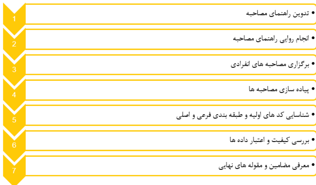
شکل ۱: مسیر انجام مطالعه

انتقال داده‌ها تلاش پژوهشگر بر این بود تا با توصیف دقیق و هدفمند فرایند تحقیق و اقدامات انجام شده در مسیر مطالعه امکان پیگیری و خصوصیات جامعه‌ی مورد مطالعه و سیر تحقیق برای دیگران فراهم گردد (Audit trailing) و همچنین افرادی که از این تحقیق بهره می‌برند با داشتن اطلاعات کافی از درون مایه‌ها طبقات و سازه‌های حاصل بتوانند در مورد تحقیق قضاوت نمایند و به‌علاوه سعی شد تا توصیفی غنی از اطلاعات برای خوانندگان فراهم شود. در این مطالعه جهت نیل به معیار تأییدپذیری با جمع‌آوری سیستماتیک داده‌ها و با رعایت بی‌طرفی، تمام مراحل مختلف به اطلاع استادان راهنما و مشاور (External checking) رسید. برای مقایسه بین آنچه که محقق برداشت کرده بود با آنچه که منظور مشارکت‌کنندگان بوده است با استادان مربوط مشاوره‌های لازم به انجام شد. همچنین تمامی مراحل انجام تحقیق به ویژه مراحل تجزیه و تحلیل داده‌ها در تمام مسیر با شرح و بسط ثبت شده است. قابلیت اعتماد معادل پایایی در مطالعات کمی است که به معنای پایداری داده‌ها در طول زمان و شرایط مشابه است که از طریق تکرار گام‌به‌گام و حسابرسی صورت می‌گیرد. در پژوهش حاضر جهت تعیین قابلیت اعتماد و تأییدپذیری، متن مصاحبه و درون مایه‌های انتخاب شده توسط ناظر خارجی بازبینی گردید (۱۶ و ۱۹).