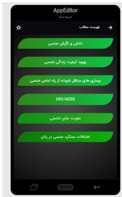
شکل ۱: صفحه فهرست ممتوا

شکل ۱، بیانگر اولین صفحه نمایشی اپلیکیشن است و در واقع شامل ۶ حیطه اصلی اپلیکیشن بوده که با انتخاب هریک می توان به زیر حیطه های مربوط دست یافت.