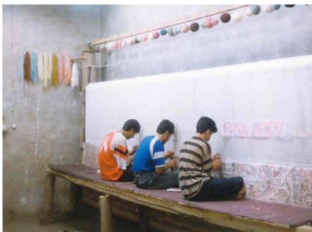
شکل ۱- سه بافنده به صورت چهارزانو بر روی تخته الوار که نقش نشستگاه را دارد نشسته‌اند و مشغول انجام عملیات بافت قالی هستند.