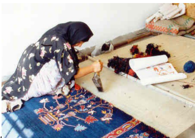
شکل ۲- قالیبافی بر روی الوار اصلی. بافنده بر روی الوار نشسته و وضعیت بدنی بسیار سلب و آسیب زا به خود گرفته است.