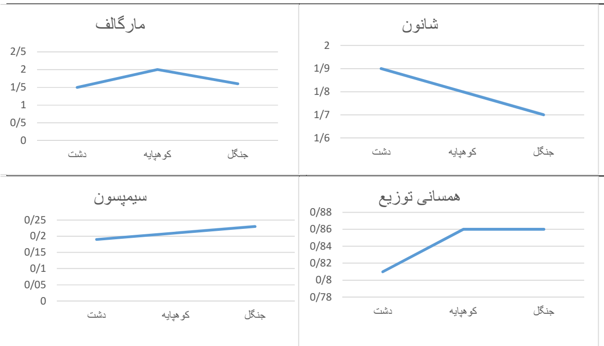
نمودار ۱- داده های حاصل از محاسبات غنای گونه ای (مارگالف) و محاسبات تنوع زیستی گونه ای (شانون-وینر، سیمپسون و همسانی توزیع) جامعه کنه های سخت بر اساس مناطق جغرافیایی، شهرستان مراوه تپه، استان گلستان، ۱۳۹۵