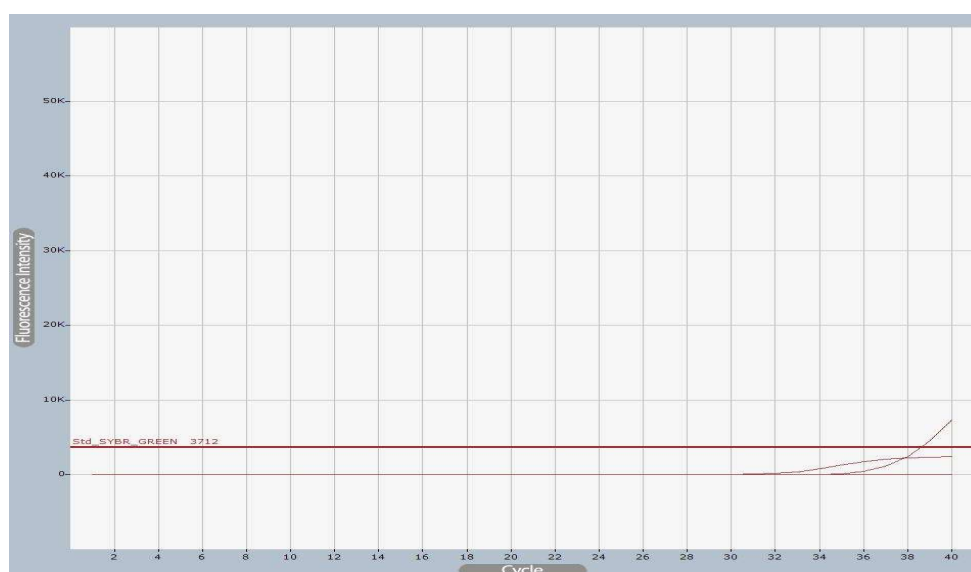
شکل ۳- نتیجه Real Time PCR منفی در جنس های استریپتومایسز، رودوکوکوس، گوردونه، مایکوباکتریوم توبرکلوزیس به همراه چند سویه استاندارد از گونه های غیر آستروئیدس (شامل نوکاردیا برازیلینسیس، نوکاردیا کاویه و نوکاردیا سیرسیجرجیکا)