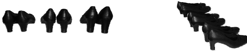
شکل ۱- نماهای مختلف کفش های آزمون