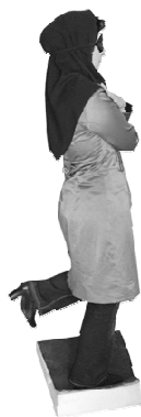
شکل ۳ = آزمون ثبات ایستا