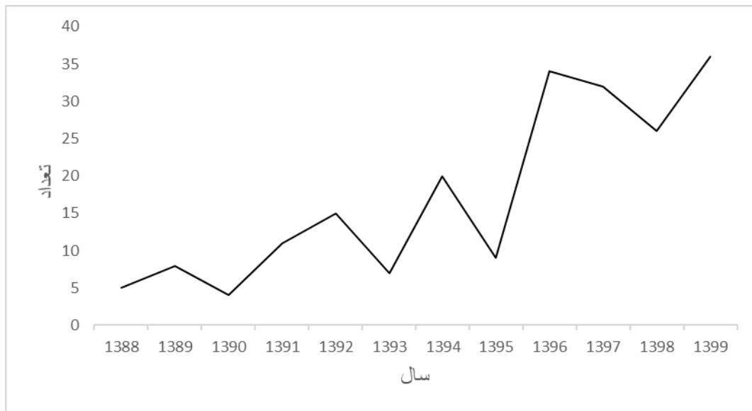
نمودار ۱- تعیین سری زمانی تعداد فارغ التحصیلان در رشته بهداشت و ایمنی مواد غذایی طی سالهای ۱۳۸۸-۱۳۹۹