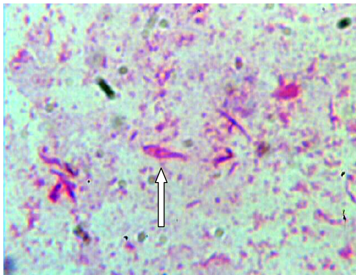
تصویر ۲- پروماستیگوت لیشمانیا اینفانتوم جدا شده از یک نمونه فلبوتوموس الکساندری تشریح شده، شهرستان ممسنی، استان فارس، ۱۳۸۳.