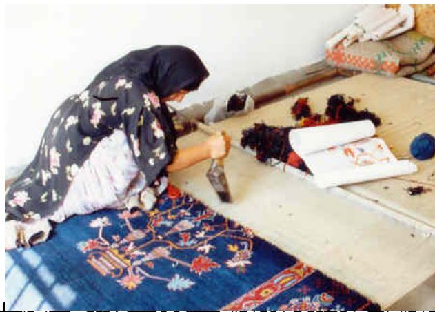
شکل ۲- قالیبافی بر روی الوار. بافنده بر روی الوار نقش و روحیت بافی بسیر سلوب و آسیب زا به خود گرفته است.