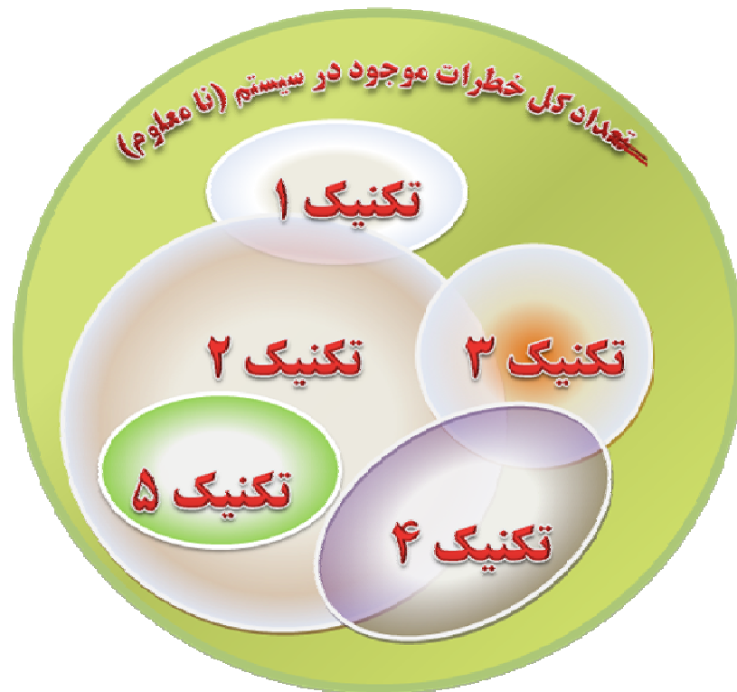
شکل ۱- محدوده کل خطرهای موجود و خطرهای شناسایی شده توسط روش های مختلف (چارچوب فکری شناسایی خطر (Suokas 1989))