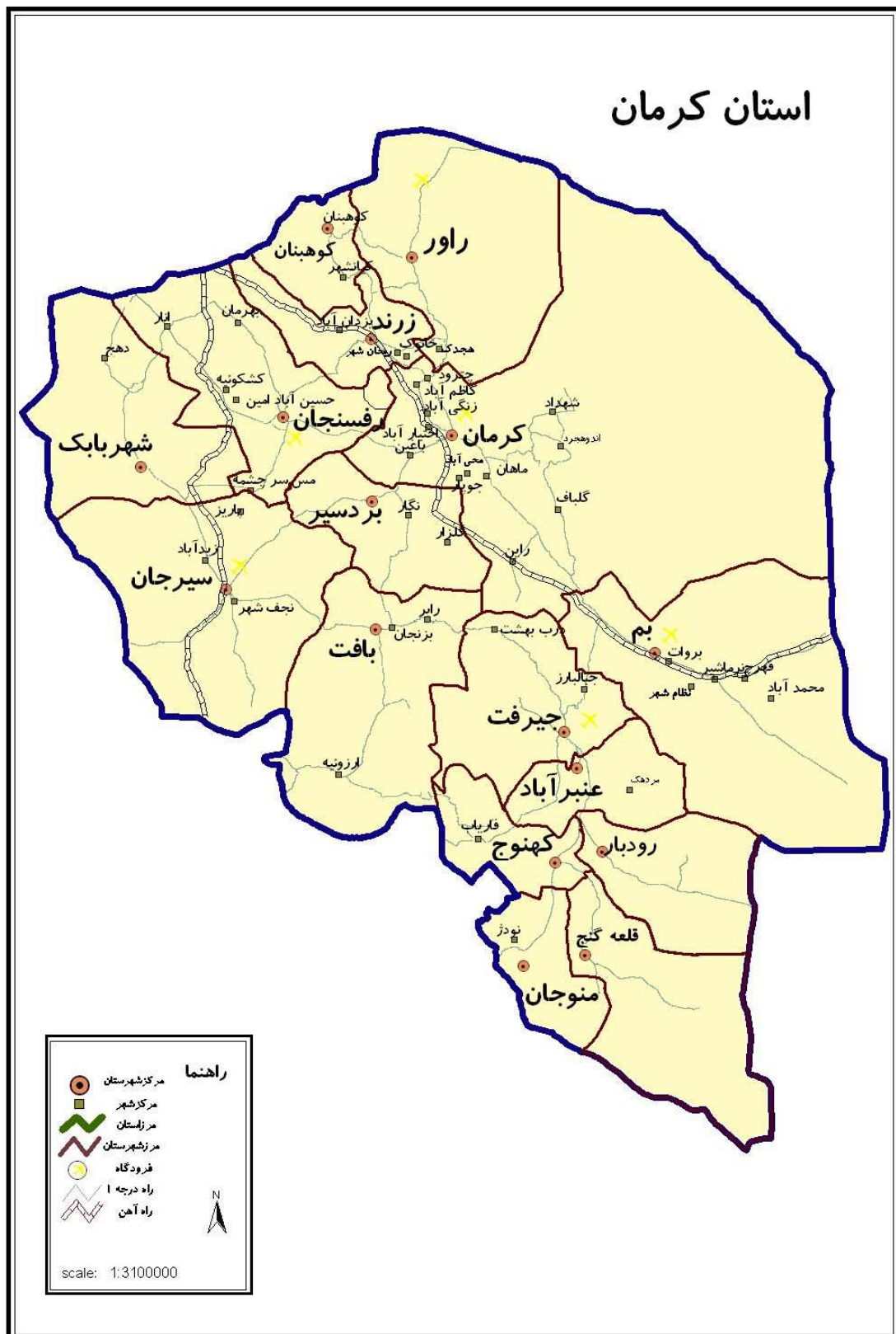
نقشه ۱- استان کرمان و موقعیت جغرافیایی شهرستان های مختلف آن