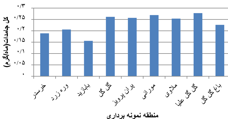
نمودار ۲- غلظت کل جامدات بر حسب (ماه/گرم) در ۹ نمونه ذرات قابل ته نشینی در ماه دوم (فروردین ۱۳۹۹) در مطالعه بررسی اجزاء معدنی ذرات رسوب شونده در مناطق کشاورزی شهرستان پلدختر (۱۳۹۸-۱۳۹۹)