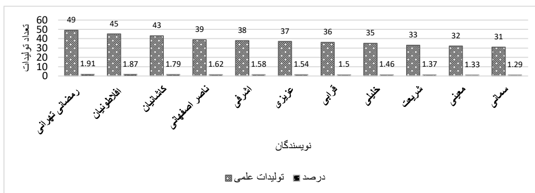
نمودار ۱: رتبه‌بندی نویسندگان پرتولید ایران از لحاظ چاپ مقاله در حوزه زنان و زایمان پیش و پس از طرح تحول نظام سلامت