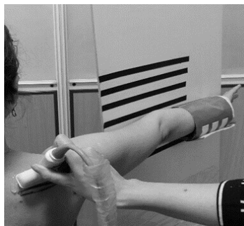
شکل ۲: ضخامت سونوگرافیک عضله در وضعیت آزمون Empty can