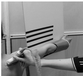
شکل ۳: ضخامت سونوگرافیک عضله در وضعیت آزمون full can