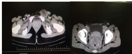
شکل ۱: سی تی اسکن لگن بیمار در دو نما. پیکان غده لنفاوی اینگوینال را نشان می دهد که حجیم و دارای مرکز نکروزه می باشد. در نمای دیگر ادم وسیع ناحیه پرینه به ویژه در سمت چپ دیده می شود.