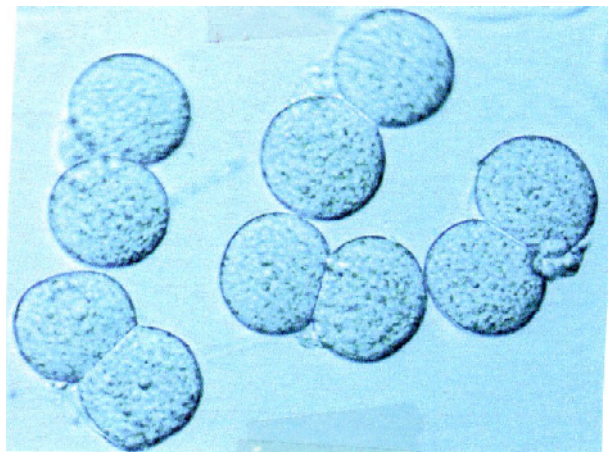
تصویر ۲- جنین‌های دو سلولی حاصل از کشت بلاستومرهای جدا شده از جنین دو سلولی در محیط کشت LIF+KSOM

در این مطالعه بلاستوسیست‌های اولیه (Early blastocyst) به آنهایی گفته می‌شد که بلاستوسل کمتر از نیمی از حجم جنین را بخود اختصاص می‌داد، بلاستوسیست (Blastocyst) به آنهایی گفته می‌شد که بلاستوسل بیش از نیمی از حجم جنین را اشغال نموده بود، بلاستوسیست کامل (Full blastocyst) به آنهایی گفته می‌شد که بلاستوسل بطور کامل جنین را اشغال نموده و نهایتاً بلاستوسیست در حال اتساع (Expanded blastocyst) به آنهایی گفته می‌شد که فقط با کشت نمونه‌های دارای پرده‌ی شفاف سالم می‌توان به