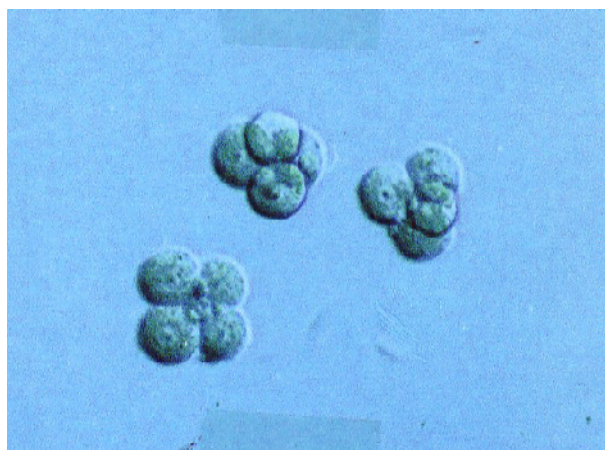
تصویر ۳ - جنین‌های چهار و پنج سلولی حاصل از کشت بلاستومرهای جدا شده از جنین‌های چهار سلولی در محیط کشت LIF+KSOM

در بلاستوسیت‌های حاصل از کشت نمونه‌های دو سلولی، 5/5 \pm 56 در بلاستوسیت‌های حاصل از کشت بلاستومرهای جدا شده از جنین‌های دو سلولی و 4/9 \pm 50 در بلاستوسیت‌های حاصل از کشت بلاستومرهای جدا شده از جنین‌های چهار سلولی بود. با مقایسه میزان سلولهای توده‌ای داخلی در بلاستوسیت‌های حاصل از کشت بلاستومرها با سلول‌های توده‌ای داخلی بلاستوسیت‌های حاصل از کشت از جنین‌های سالم و دست نخورده مشاهده می‌شود که میزان این سلول‌ها در بلاستوسیت‌های حاصل از کشت بلاستومرها کمتر است ( P < 0.05 )، حال آنکه میزان سلول‌های توده‌ای خارجی در هر چهار گروه مورد مطالعه با همدیگر تفاوت معنی‌داری را نشان نمی‌دهد ( P > 0.05 ). لازم به ذکر است که از 166 بلاستومر جدا شده از جنین دو سلولی 122 بلاستومر ( 37/49 درصد) و از 164 بلاستومر جدا شده از جنین‌های چهار سلولی 119 بلاستومر ( 72/59 درصد) تقسیمات کلیواژی خود را طی 24 ساعت اولیه کشت آغاز نمودند که میزان این تقسیمات با یکدیگر تفاوت معنی‌داری را نشان نمی‌دهد ( P > 0.05 ).