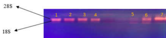
شکل ۱: الکتروفورز بر روی ژل آگارز برای بررسی کیفیت RNA استخراج شده. شماره ۱-۶: نمونه‌ها، شماره ۷: مارکر.

نسبت جذب ۲۶۰ به ۲۸۰ nm تعیین کننده خلوص اسیدهای نوکلئیک می‌باشد و در پژوهش کنونی، این نسبت جذب، بین ۱/۸ تا ۲ بود و کیفیت RNAهای استخراج شده، تایید شد. میزان کارایی