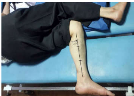
شکل ۲: روش تعیین نقطه سوزن زدن برای عضله خم کننده بلند انگشتان در وضعیت به پهلو خوابیده