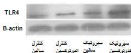
شکل ۲: تصویر وسترن بلات از بیان رسپتور TLR4 در کورتکس مغز در موش‌های صحرائی سالم یا مبتلا به سیروز تحت درمان نرمال سالیین و یا اندوتوکسین