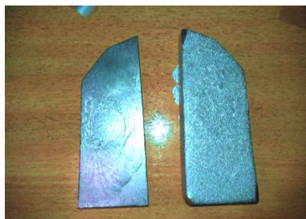
شکل ۱: تصویر بلاک‌های ریوی

گردن در حد تیروئید، لوب میانی ریه، شکم در حد ناف، لگن در استخوان سمفیز پویس، وسط ران، زانو و ساق پا اندازه‌گیری شد. ۱۱ به منظور تابش‌دهی، فانتوم روی تخت TBI و در فاصله ۳۱۲ سانتی‌متری نسبت به منبع پرتو و پنج سانتی‌متری نسبت به اسپویلر در موقعیت به پهلو قرار گرفت. فانتوم به شکلی موقعیت‌دهی شد که محور مرکزی دسته پرتو در امتداد ناف واقع شود. به منظور حفاظت ریه‌ها در برابر دریافت پرتو مازاد، شیلدهای ریوی روی دیواره تخت (اسپویلر) و در محدوده ریه‌ها نصب شدند.