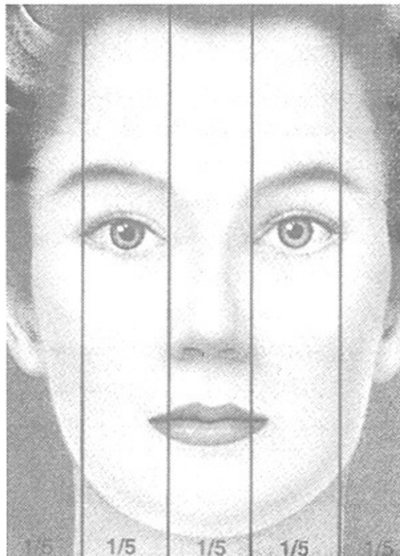
شکل شماره ۱- پهنای صورت: براساس پهنای صورت نرمال که مساوی ۵ فاصله اینترکانتال میباشد

استخوان بینی در ناحیه base در ۱۸ بیمار ۲۱/۹٪ طبیعی، در ۲۳ بیمار (۲۸٪) پهن ۳۹ (۴۷/۵٪) باریک ۲ و در ۲ بیمار ۲/۴٪ منحرف بود.