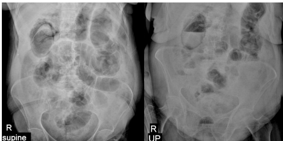
شکل ۲: گرافی خوابیده و ایستاده شکم با هوا در لومن و جدار کیسه صفرا و ریگلسایین

اورژانس مراجعه کرده بود و با تشخیص کوله سیستیت آمفیزماتو تحت کوله سیستکتومی اورژانس قرار گرفته بود، معرفی می شود. کوله سیستیت آمفیزماتو با کوله سیستیت حاد ناشی از سنگ از نظر پاتولوژی و اپیدمیولوژی تفاوت دارد. ۶ کوله سیستیت حاد و مزمن معمولاً به دلیل انسداد گردن کیسه صفرا با سنگ صفراوی ایجاد می شوند، در حالی که کوله سیستیت آمفیزماتو به دلیل نکروز کیسه صفرا ناشی از انسداد یا ترومبوز شریان سیستیک رخ می دهد. ۷ اگر کوله سیستیت آمفیزماتو درمان نشود، بیماری پیشرفت کرده و سبب گانگرن احشاء می شود. میکروارگانیزمها به صورت هماتوژن در عضلات پنخس شده و منجر به شوک سپتیک می شوند. ۸ کوله سیستیت امفیزماتو معمولاً به دلیل افزایش بروز گانگرن و پرفوراسیون جدار کیسه صفرا مورتالیتی بالایی دارد که بین ۱۵ تا ۲۰٪ متغیر است، هرچند تشخیص و درمان زود هنگام در بهبود وضعیت بیمار موثر است. ۷ در مطالعه‌ای که توسط Sayit انجام شد در آزمایشات فرد مبتلا به کوله سیستیت آمفیزماتو، لکوسیتوز با افزایش درصد نوتروفیل و همچنین افزایش سطح بیلی روبین توتال و مستقیم گزارش شد. در مطالعه‌ای دیگر نیز لکوسیتوز به همراه افزایش درصد نوتروفیل، افزایش امینوترانسفرازها و بیلی روبین گزارش شد. ۹ در مطالعه حاضر نیز لکوسیتوز با افزایش درصد نوتروفیل و همچنین