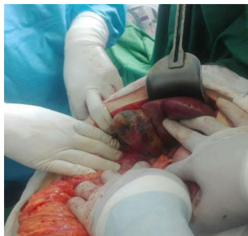
شکل ۳: گرافی کیسه صفرا حین عمل کوله سیستکتومی که گانگرنه و نکروزه است.

اورژانس مراجعه کرده بود و با تشخیص کوله سیستیت آمفیزماتو تحت کوله سیستکتومی اورژانس قرار گرفته بود، معرفی می شود. کوله سیستیت آمفیزماتو با کوله سیستیت حاد ناشی از سنگ از نظر پاتولوژی و اپیدمیولوژی تفاوت دارد. ۶ کوله سیستیت حاد و مزمن معمولاً به دلیل انسداد گردن کیسه صفرا با سنگ صفراوی ایجاد می شوند، در حالی که کوله سیستیت آمفیزماتو به دلیل نکروز کیسه صفرا ناشی از انسداد یا ترومبوز شریان سیستیک رخ می دهد. ۷ اگر کوله سیستیت آمفیزماتو درمان نشود، بیماری پیشرفت کرده و سبب گانگرن احشاء می شود. میکروارگانیزمها به صورت هماتوژن در عضلات پنخس شده و منجر به شوک سپتیک می شوند. ۸ کوله سیستیت امفیزماتو معمولاً به دلیل افزایش بروز گانگرن و پرفوراسیون جدار کیسه صفرا مورتالیتی بالایی دارد که بین ۱۵ تا ۲۰٪ متغیر است، هرچند تشخیص و درمان زود هنگام در بهبود وضعیت بیمار موثر است. ۷ در مطالعه‌ای که توسط Sayit انجام شد در آزمایشات فرد مبتلا به کوله سیستیت آمفیزماتو، لکوسیتوز با افزایش درصد نوتروفیل و همچنین افزایش سطح بیلی روبین توتال و مستقیم گزارش شد. در مطالعه‌ای دیگر نیز لکوسیتوز به همراه افزایش درصد نوتروفیل، افزایش امینوترانسفرازها و بیلی روبین گزارش شد. ۹ در مطالعه حاضر نیز لکوسیتوز با افزایش درصد نوتروفیل و همچنین