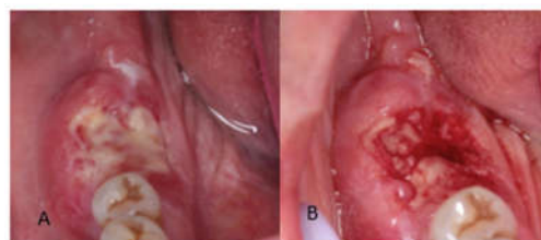
شکل ۱: نمای داخل دهانی ضایعه که تورم و زخم وسیع ۲×۲ cm با حاشیه برجسته در محل دندان مولر اول دیده می‌شود.

گردیده و بافت همبند در مجاورت صفحات سلولی مهاجم ارتشاح سلول‌های التهابی را نشان می‌داد و تشخیص Squamous Cell Cacinoma با Grade2 گذاشته شد. عکس‌های پاتولوژی با دوربین دیجیتال True Chrome Metric گرفته شد (شکل ۳). در سی‌تی اسکن گردن با کنتراست تزریق: حفره بینی و سینوس‌های پاراناژال، نازوفارنکس، قاعده و کف دهان، هایپوفارنکس، حنجره، نای، غدد پاروتید و تحت فکی نرمال بوده و ضایعه‌ای در تیروئید مشاهده نشد. در نمای (Window) استخوان، کانون استئوپنیک در قدام مندیبل در سطح دندان‌های مشاهده شد که همراه آن چند لئف‌نود واضح (Prominent) به قطر