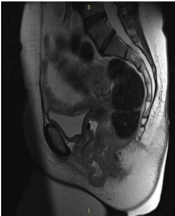
تصویر ۲: (A) نمای توده در تصاویر T2 سائیتال به صورت high signal است.