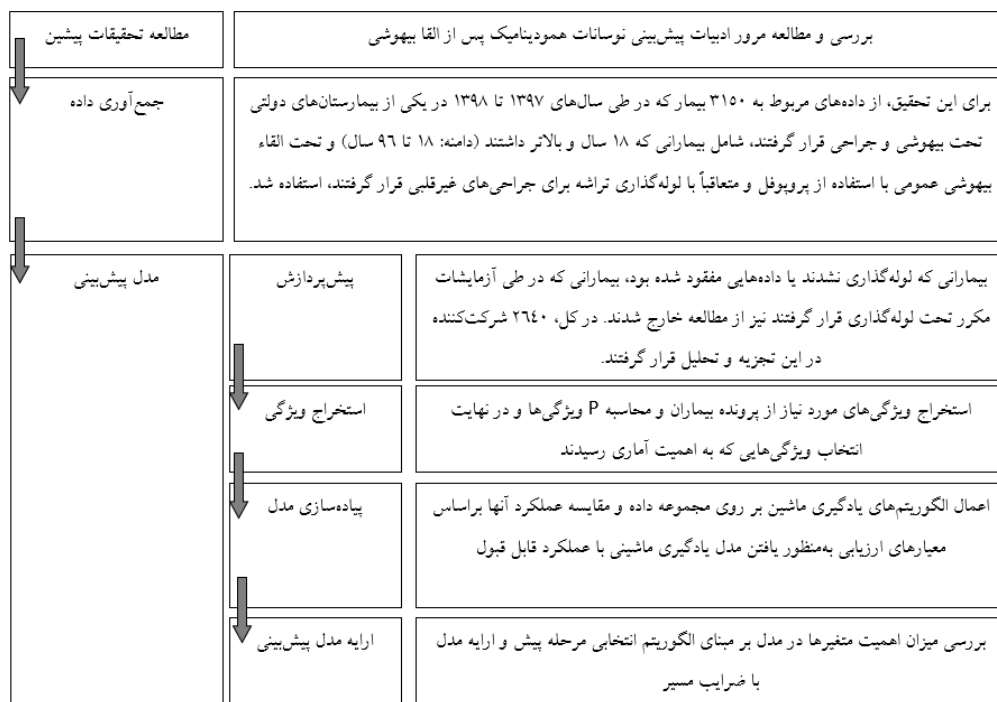
شکل ۱: گام‌های اصلی تحقیق

بیهوشی به‌طور خودکار در پرونده‌های بیهوشی ذخیره می‌شدند، درحالی‌که دوز دارو و تکنیک‌های بیهوشی به‌صورت دستی ثبت می‌شدند. در اتاق عمل، بیماران در وضعیت خوابیده به پشت خوابانده شدند. داده‌های پایه مانند الکتروکاردیوگرافی و پالس‌اکسی‌متری از سوابق مانیتورهای استاندارد به‌دست آمد. القای بیهوشی عمومی توسط پروپوفول (Propofol)، فنتانیل (Fentanyl)، رمیفنتانیل (Remifentanyl) و آتراکوریوم (Atracurium) انجام گردید و ادامه آن با بیهوشی استنشاقی (ایزوفلوران) (Isoflurane) انجام شد. انتخاب داروهای القایی و دوزها بستگی به قضاوت بالینی متخصص بیهوشی براساس شرایط پزشکی بیماران دارد. لارنگوسکوپ و لوله‌گذاری داخل دهانی توسط متخصص بیهوشی یا تکنیسین بیهوشی انجام شد.