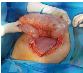
شکل ۲: کولون عرضی متسع پس از دتورشن به همراه رحم ۳۰ هفته مشهود است.