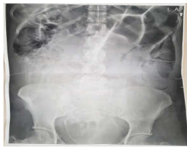
شکل ۱: درگرافی خوابیده و ایستاده شکمی معده و لوپ‌های روده کاملاً متسع و پر گاز است.

(Anal vrge) تغییر رنگ مخاط ارغوانی رویت شد و ترشحات داخل لومن سیگموئید به صورت خونی رویت شد. نکروز ایسکمیک برای بیمار مطرح شد. با احتمال قوی ولولوس، بیمار منتقل اتاق عمل شد. تحت شرایط استریل اتاق عمل پس از پرپ و درپ، تحت بیهوشی عمومی در پوزیشن سوپاین با انسزیون میدلاین شکم باز شد. در بدو ورود هوا خارج نشد. مختصری مایع در شکم وجود داشت که ساکشن شد. شکم تمیز بود، رحم باردار ۳۰ هفته مشاهده شد. در بررسی کولون سیگموئید و کولون عرضی به شدت متسع و دولیکوسیگموئید (Dolichosigmoid) واضح وجود داشت که Detorsion صورت پذیرفت (شکل ۲). سایر قسمت‌های کولون و روده باریک و رکتوم بررسی شد که یافته پاتولوژیکی رویت نگردید. یک عدد رکتال تیوب جهت دکمپرس کردن کولون تعبیه گردید. سپس لویی از سیگموئید از بین الباف عضلات رکتوس از جدار شکم خارج گردید. شکم در پلان آناتومیک بسته شد و در انتها کولستومی ماچور (Mature) شد. باتوجه به عدم آمادگی روده و امکان نشت از محل آناتوموز سیگموئیدکتومی انجام نشد و جراحی رزکشن سیگموئید بیمار موکول به پس از زایمان، برطرف شدن اثر فشاری رحم باردار، پایدار شدن شرایط بیمار و آمادگی روده‌ای وی گردید. پس از چهار روز بیمار باحال عمومی خوب مرخص شد.