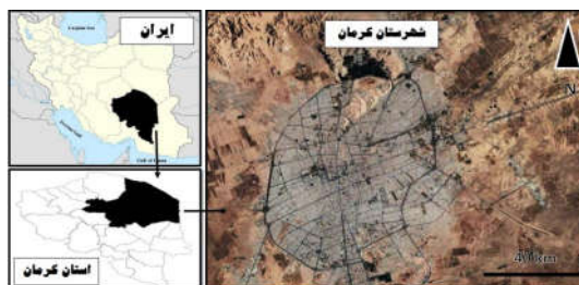
شکل ۱: نقشه محل مورد مطالعه، شهر کرمان، استان کرمان، جنوب شرقی ایران

از مجموع ۲۸۵۰ دانش‌آموز که توسط پژوهشگر معاینه شدند ۱۷۹ عدد پرسشنامه تکمیل گردید، ۱۱۹ دانش‌آموز از ناحیه یک آموزش و پرورش ( 10/08 \pm 0/027 ) و ۶۰ دانش‌آموز از ناحیه دو