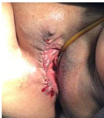
شکل ۲: پس از جراحی

بیمار خانم ۵۴ ساله منوپوز بدون سابقه بیماری با شکایت توده ناحیه پرینه مراجعه کرد. بیمار بیان می‌کرد که از حدود ۱۰ سال پیش متوجه این توده شده است که طی دو سال اخیر بزرگتر شده است. بیمار هیچگونه علامت همراهی مانند علائم ادراری، گوارشی و دیس پارونی را بیان نمی‌کرد و فقط از بزرگ شدن توده نگران بود. در معاینه اولیه یک توده با قطر حدوداً ۱۵ cm با قوام نرم و با ظاهر صاف بدون تندرئس و بدون اریتم در لبیا ماژور راست وجود داشت (شکل ۱). معاینه رکتوم نرمال بود و توده اثر بر روی مجرای ادراری نداشت. با توجه به موقعیت توده برای بیمار احتمال هرنی اینگوینال و یا هرنی کانال NUCK مطرح شد. جهت بررسی هرنی اینگوینال (Inguinal hernia)، بیمار تحت سونوگرافی قرار گرفت که هرنی