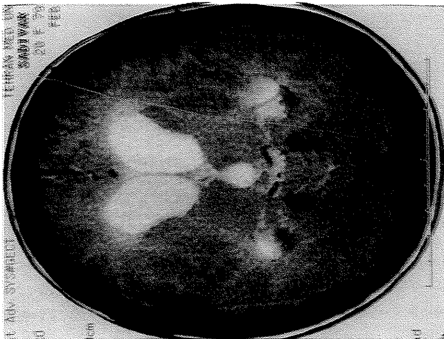
تصویر شماره ۲- کاهش پنوموسفالوس نسبت به سی تی اسکن قبلی